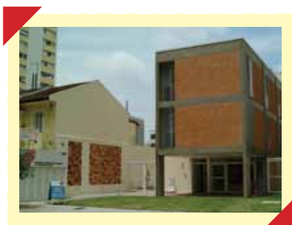
Fachada da sede da ACTC.

Nos meses de julho, agosto e setembro, recebemos muitas visitas, que vieram conhecer de perto as atividades e os trabalhos desenvolvidos pela ACTC. Agradecemos o interesse e aguardamos o retorno de todos.