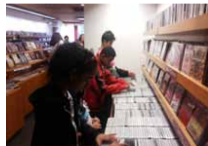
Jovens da ACTC escolhem acervo de DVDs para a DVDteca da Unidade II na Livraria da Villa.