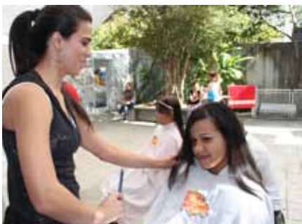
Crianças e adolescentes são atendidos pelos funcionários da GlitzMania.

Funcionários da rede de salão de cabeleireiro passam tarde na ACTC. Texto produzido por Flaviana Oliveria.