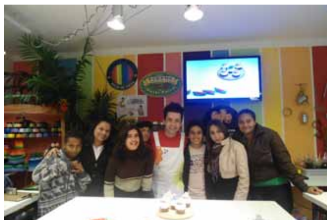
O grupo de jovens em Oficina de Design em Glicerina.